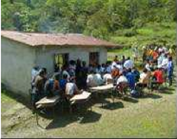
Foto 8: Reunión en el Maizal de la Misión Humanitaria con líderes de la comunidad