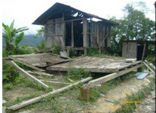
Foto 6: Vivienda destrozada en una operación de desactivación de explosivos por parte de la FFPP