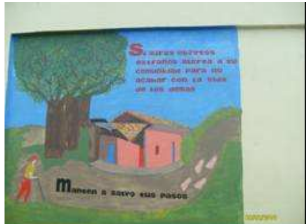
Foto 4: Campaña adelantada por la comunidad educativa de Chuguldi